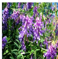
ヘアリーベッチ蜂蜜

養蜂場に種蒔きをして採取。ヘアリーベッチはマメ科で紫色の花を付けます。ふんわりと柔らかな香りとフルーティーな味の蜂蜜。