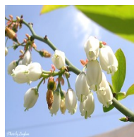
ブルーベリー蜂蜜

鳥栖市のブルーベリー農園で採取。フルーティーでやさしい甘さが特徴の蜂蜜です。乳製品によく合います。