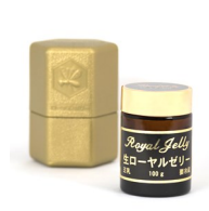
生ローヤルゼリー

女王蜂の特別食であるローヤルゼリー。長寿に関係すると言われているデセン酸や、多くのタンパク質を保有していることで高く評価されています。